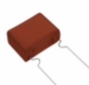
ECW-F2335JAB Panasonic Electronic Components CAP FILM 3.3UF 5% 250VDC RADIAL