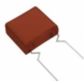
ECW-F2335JAQ Panasonic Electronic Components CAP FILM 3.3UF 5% 250VDC RADIAL