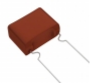
ECW-F2335HAB Panasonic Electronic Components CAP FILM 3.3UF 3% 250VDC RADIAL