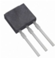
L4006V8 Littelfuse Inc. TRIAC SENS GATE 400V 6A TO251