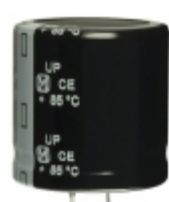
ECO-S1CP393EA Panasonic Electronic Components CAP ALUM 39000UF 20% 16V SNAP