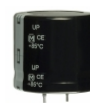
ECO-S1CP333EA Panasonic Electronic Components CAP ALUM 33000UF 20% 16V SNAP