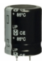
ECO-S1CP183CA Panasonic Electronic Components CAP ALUM 18000UF 20% 16V SNAP