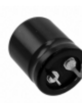
ECO-S1CP472BA Panasonic Electronic Components CAP ALUM 4700UF 20% 16V SNAP