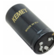
ALF20G222EH200 KEMET CAP ALU 2200UF 20% 200V PRESSFIT