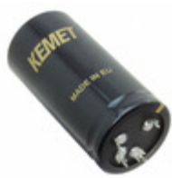
ALF20G271ED500 KEMET CAP ALU 270UF 20% 500V PRESSFIT