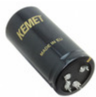
ALF20G223ED040 KEMET CAP ALU 2200UF 20% 40V PRESSFIT