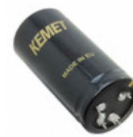
ALF20G222EL250 KEMET CAP ALU 2200UF 20% 250V PRESSFIT