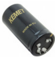
ALF20G271EC450 KEMET CAP ALU 270UF 20% 450V PRESSFIT