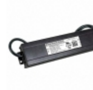
PLED200W-445-C0450-D Thomas Research Products LED DRVR CC AC/DC 149-445V 450MA