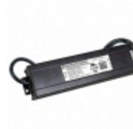
PLED200W-445 Thomas Research Products LED DRIVER CV AC/DC 445V 450MA