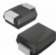
PLED350S Hamlin / Littelfuse LED PROTECTOR BI 320V DO214 2L