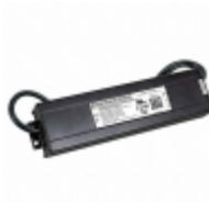
PLED200W-445-C0450 Thomas Research Products LED DRVR CC AC/DC 149-445V 450MA