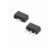
PLED5HT Littelfuse Inc. LED PROTECTOR 5V BI-DIR SOT-89