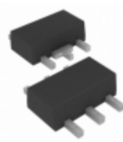
MCP1804T-2502I/MT Microchip Technology IC REG LDO 2.5V 0.1A SOT89-5