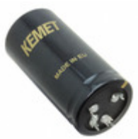
ALF20G391ED400 KEMET CAP ALU 390UF 20% 400V PRESSFIT