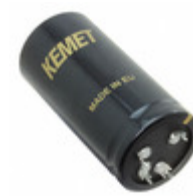
ALF20G333EF035 KEMET CAP ALU 33000UF 20% 35V PRESSFIT