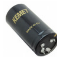
ALF20G333EH040 KEMET CAP ALU 33000UF 20% 40V PRESSFIT