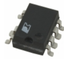
TNY263GN Power Integrations IC OFFLINE SWIT OTP OCP HV 8SMD