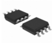
MIC29201-3.3BM Microchip Technology IC REG LDO 3.3V 0.4A 8SOIC