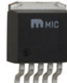
MIC29201-3.3WU Microchip Technology IC REG LDO 3.3V 0.4A TO263-5