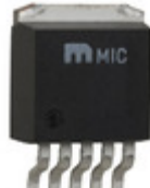
MIC29201-3.3BU TR Microchip Technology IC REG LDO 3.3V 0.4A TO263-5