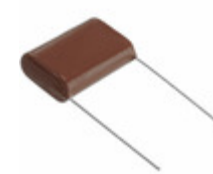
ECQ-E4225JFW Panasonic Electronic Components CAP FILM 2.2UF 5% 400VDC RADIAL