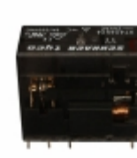
XT424524 Agastat Relays / TE Connectivity RELAY GEN PURPOSE DPDT 8A 24V