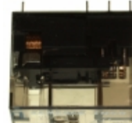
XT424012 TE Connectivity Potter & Brumfield Relays RELAY GEN PURPOSE DPDT 8A 12V