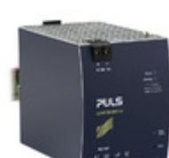
XT40.722 PULS DIN RAIL PSU 960W 72V 13.3A