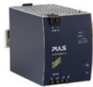
XT40.721 PULS DIN RAIL PSU 960W 72V 13.3A