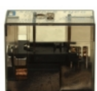
XT424024 TE Connectivity Potter & Brumfield Relays RELAY GEN PURPOSE DPDT 8A 24V