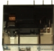
XT424012 Agastat Relays / TE Connectivity RELAY GEN PURPOSE DPDT 8A 12V