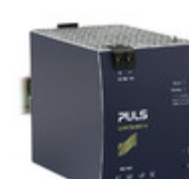
XT40.481 PULS DIN RAIL PWR SUPPLY 960W 48V 20A