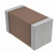
CGA3E1COG2A392J080AC TDK Corporation CAP CER 3900PF 100V C0G 0603