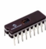
PIC16C620A/JW Microchip Technology IC MCU 8BIT 896B EPROM 18CERDIP