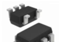
EL5151IWZ-T7 Intersil IC OPAMP VFB 40MHZ SOT23-5