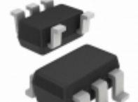
EL5151IW-T7 Intersil IC OPAMP VFB 40MHZ SOT23-5