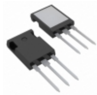
IXGR6N170A IXYS IGBT 1700V 5.5A 50W ISOPLUS247