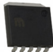
MIC37152WR Microchip Technology IC REG LDO ADJ 1.5A SPAK-5