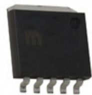
MIC37151-3.3WR Microchip Technology IC REG LDO 3.3V 1.5A SPAK-5