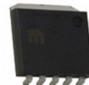
MIC37152WR-TR Microchip Technology IC REG LDO ADJ 1.5A SPAK-5