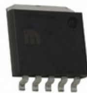
MIC37151-3.3BR TR Microchip Technology IC REG LDO 3.3V 1.5A SPAK-5