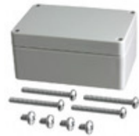
RB53P06G16G Serpac Electronic Enclosures BOX PLASTIC GRAY 4.72"L X 3.15"W