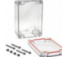
RB53P06C16C Serpac Electronic Enclosures BOX PLSTC CLEAR 4.72"L X 3.15"W