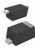
RB531SM-30T2R Rohm Semiconductor DIODE SCHOTTKY 30V 200MA EMD2