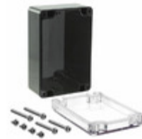
RB53P06C16B Serpac Electronic Enclosures BOX PLSTC BLK/CLR 4.72"LX3.15"W