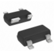
TC1270SERCTR Microchip Technology IC RESET MONITOR 2.93V SOT143-4