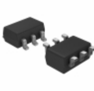
MIC5321-MKYD6-TR Microchip Technology IC REG LDO 2.8V/2.6V TSOT23-6