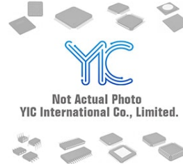
MIC5200-3.3YSTR MICREL MICREL SOT223