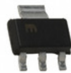
MIC5200-4.8YS Microchip Technology IC REG LDO 4.8V 0.1A SOT223