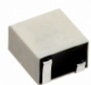
CFUKF455KC4X-R0 Murata Electronics North America FILTER