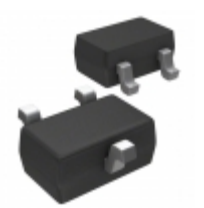
MIC803-46D3VC3-TR Microchip Technology IC MPU SUPERVISOR SC70-3