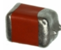
13008-060MESZ Vishay Sprague CAP TANT 47UF 35V 20% 2917