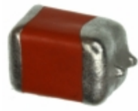
13008-060MESZ/HR Vishay Sprague CAP TANT 47UF 35V 20% 2917