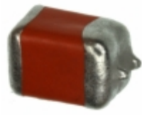
13008-060MESZ Electro-Films (EFI) / Vishay CAP TANT 47UF 35V 20% 2917