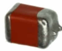
13008-060MESZ Vishay Sprague CAP TANT 47UF 35V 20% 2917