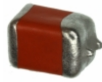
13008-061KESA Vishay Sprague CAP TANT 68UF 35V 10% 2917