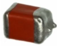
13008-061KESA/HR Vishay Sprague CAP TANT 68UF 35V 10% 2917