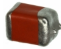
13008-061KESA Electro-Films (EFI) / Vishay CAP TANT 68UF 35V 10% 2917