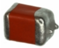
13008-060MESZ/HR Electro-Films (EFI) / Vishay CAP TANT 47UF 35V 20% 2917