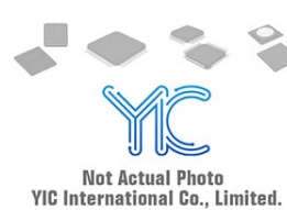
24LC64T-I/SM SOP5.2 MICROCHIP 24LC64T-I/SM SOP5.2 MICROCHIP