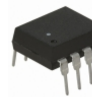
HCNW137 Avago Technologies (Broadcom Limited) OPTOISO 5KV OPEN COLLECTOR 8DIP