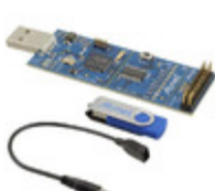
AT97SC3205P-SDK2 Micrel / Microchip Technology DEMO KIT FOR 97SC3204