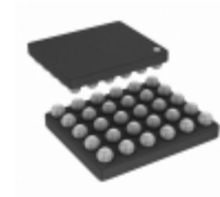
FAN54300UCX Fairchild/ON Semiconductor IC USB SW CHARGER LI-ION 30WLCSP