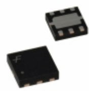
FAN5601MP13X Fairchild/ON Semiconductor IC REG SWITCHD CAP 1.3V 6MLP