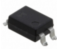
APT1221A Panasonic Electric Works OPTOISOLATOR 5KV TRIAC 4SMD