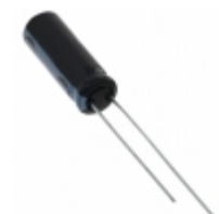
EEC-A0EL105 Panasonic Electronic Components CAP 1F -20% +80% 2.5V T/H