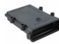
EEC-5X650A Agastat Relays / TE Connectivity DT ENCLOSURE WITH VENT HOLE, BLK