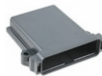
EEC-325X4B Agastat Relays / TE Connectivity DTM ENCLOSURE BLK