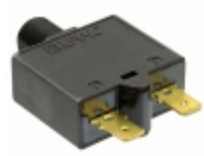
1658-G41-02-P10-20A E-T-A CIR BRKR THRM 20A 240VAC 28VDC