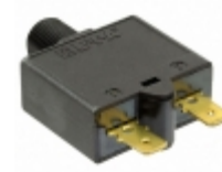
1658-G41-02-P10-25A E-T-A CIR BRKR THRM 25A 240VAC 28VDC