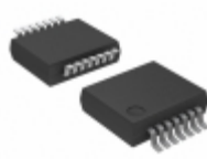
74HCT280DB,118 Nexperia IC 9-BIT GEN/CHKER 14SSOP