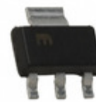
MIC5209-3.0YS Microchip Technology IC REG LDO 3V 0.5A SOT223