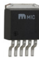
MIC5209-3.0YU Microchip Technology IC REG LDO 3V 0.5A TO263-5