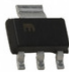
MIC5209-3.0BS Microchip Technology IC REG LDO 3V 0.5A SOT223