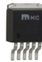
MIC5209-3.0BU Microchip Technology IC REG LDO 3V 0.5A TO263-5