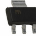
MIC5209-3.0BS TR Microchip Technology IC REG LDO 3V 0.5A SOT223