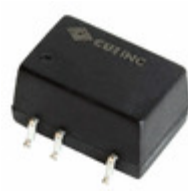
PDS1-S12-S5-M CUI Inc. CONVERT DC/DC 1W 5V 200MA OUTPUT