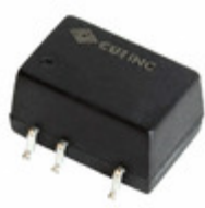
PDS1-S12-S9-M CUI Inc. CONVERT DC/DC 1W 9V 111MA OUTPUT