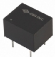
PDS1-S12-S3-D CUI Inc. CONVERT DC/DC 1W 3.3V 42MA OUT