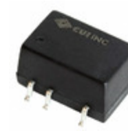
PDS1-S12-S5-M-TR CUI Inc. CONVERT DC/DC 1W 5V 200MA OUT