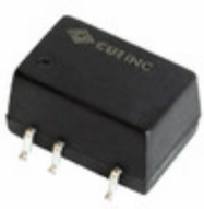
PDS1-S12-S3-M-TR CUI Inc. DC/DC CONVERTER 3.3V 1W