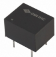
PDS1-S12-S9-D CUI Inc. CONVERT DC/DC 1W 9V 200MA OUT