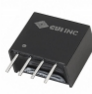
PDS1-S12-S3-S CUI Inc. DC/DC CONVERTER 3.3V 1W