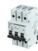
GMB633PC6 Carlo Gavazzi CIR BRKR THERM-MAG 6A 240VAC