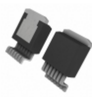
LT1580IR-2.5#PBF Linear Technology IC LDO REGULATOR 7A 2.5V DDPAK-7