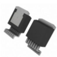
LT1580IR-2.5#TRPBF Linear Technology IC LDO REGULATOR 7A 2.5V DDPAK-7