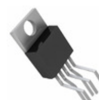
LT1580IT#PBF Linear Technology IC LDO REGULATOR 7A ADJ TO220-5