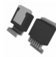
LT1580IR-2.5#PBF ADI (Analog Devices, Inc.) IC LDO REGULATOR 7A 2.5V DDPAK-7