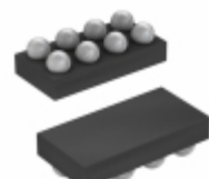
MAX8559EBAAA+T Maxim Integrated IC REG LDO 3.3V 0.3A 8UCSP