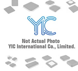
MAX8559EBAILI MAXIM MAX8559EBAILI MAXIM