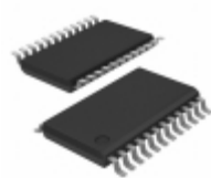
ATF22V10CQZ-20XU Microchip Technology IC PLD 10MC 20NS 24TSSOP