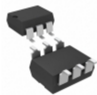
LDA102STR IXYS Integrated Circuits Division OPTOISO 3.75KV TRANS W/BASE 6SMD