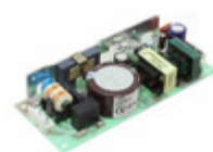
LDA100W-9-Y Cosel AC/DC PS (OPEN FRAME)