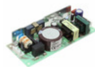
LDA100W-9-SNY Cosel AC/DC PS (OPEN FRAME)