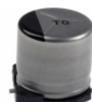
EEV-TG1V101P Panasonic Electronic Components CAP ALUM 100UF 20% 35V SMD