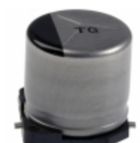
EEV-TG1K470UP Panasonic Electronic Components CAP ALUM 47UF 20% 80V SMD