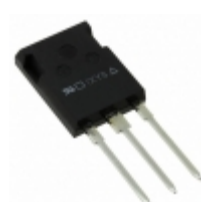
IXTR170P10P IXYS MOSFET P-CH 100V 108A ISOPLUS247