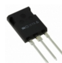
IXTR30N25 IXYS MOSFET N-CH 250V 25A ISOPLUS247