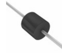
GI822-E3/54 Electro-Films (EFI) / Vishay Division DIODE GEN PURP 200V 5A P600