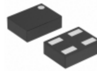
XC6119N21A7R-G Torex Semiconductor Ltd IC VOLT DET TIME DLY 2.1V 4- USPN