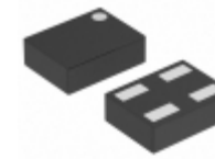
XC6119N19A7R-G Torex Semiconductor Ltd IC VOLT DET TIME DLY 1.9V 4- USPN