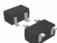
XC6119N18ANR-G Torex Semiconductor Ltd IC VOLT SUPERVISOR SSOT-24