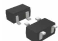
XC6119N19ANR-G Torex Semiconductor Ltd IC VOLT DET TIME DLY 1.9V SSOT-2