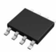
BD3520FVM-TR Rohm Semiconductor IC REG CTRLR SGL 1.2V 8MSOP