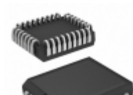
AT27BV512-70JI Microchip Technology IC OTP 512KBIT 70NS 32PLCC