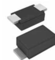
RS07D-GS18 Electro-Films (EFI) / Vishay DIODE GP 200V 500MA DO219AB