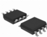
MIC5239-2.5YMM Microchip Technology IC REG LDO 2.5V 0.5A 8MSOP