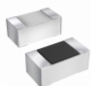
04023J0R1BBWTR AVX Corporation CAP THIN FILM 0.1PF 25V 0402