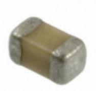
04023D223MAT2A AVX Corporation CAP CER 0.022UF 25V X5R 0402