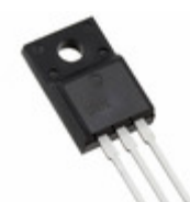
IXFP30N25X3M IXYS Corporation MOSFET N-CHANNEL 250V 30A TO220