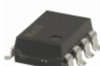
AQW280EHAZ Panasonic RELAY OPTO AC/DC 350V 120MA 8SMD