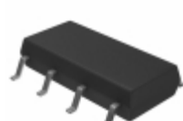
AQW282S Panasonic RELAY OPTO AC/DC 60V 350MA 8-SOP