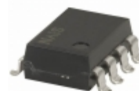
AQW282EHAZ Panasonic RELAY OPTO AC/DC 60V 400MA 8-SMD