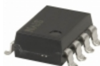
AQW282EHA Panasonic RELAY OPTO AC/DC 60V 400MA 8-SMD