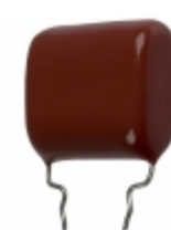
ECQ-P1H224FZW Panasonic Electronic Components CAP FILM 0.22UF 1% 50VDC RADIAL