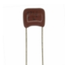
ECQ-P1H271JZ Panasonic Electronic Components CAP FILM 270PF 5% 50VDC RADIAL